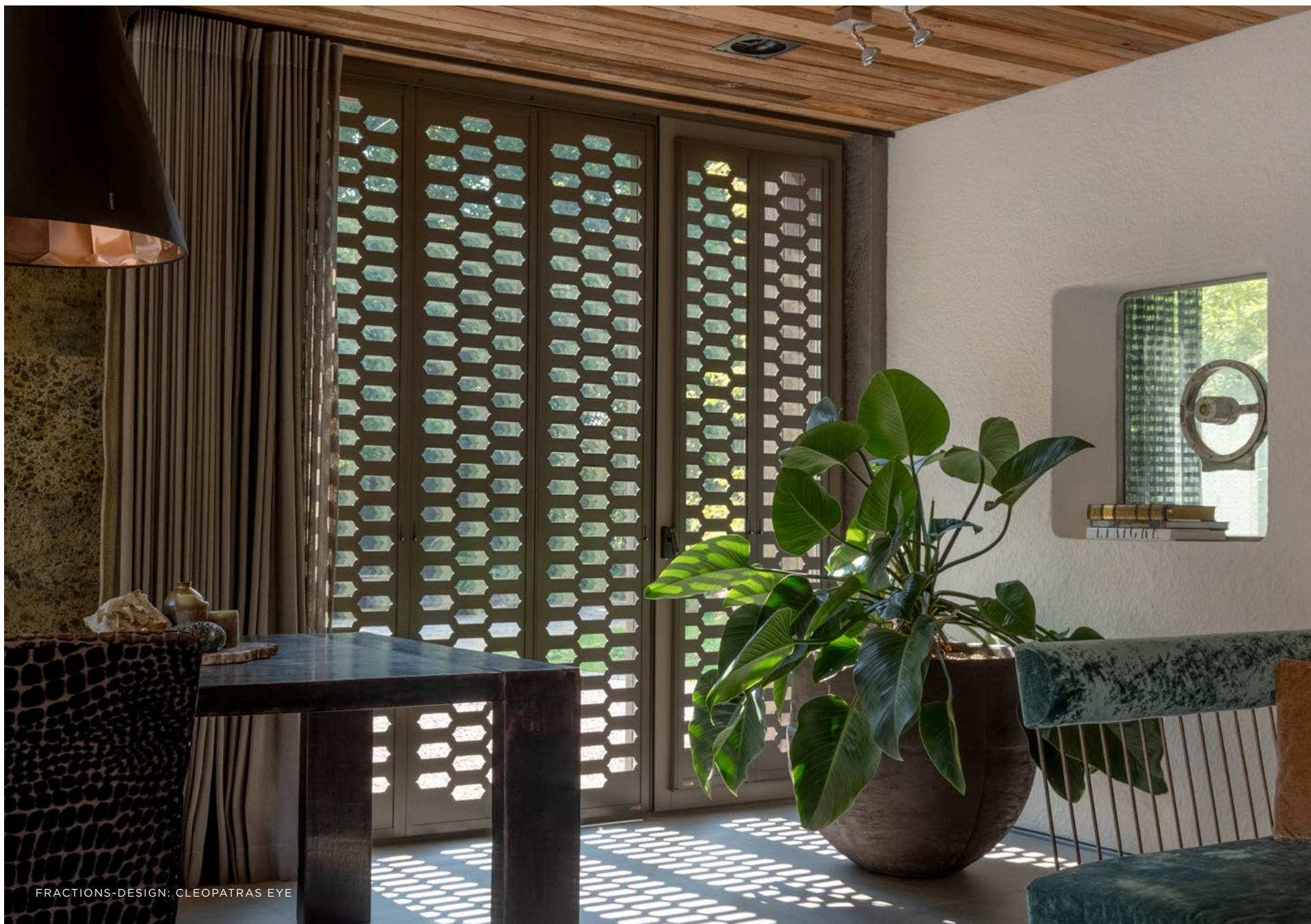
FRACTIONS-DESIGN: CLEOPATRAS EYE